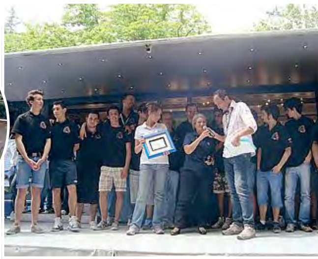
ECOMOBILITY Ancoragiovani delle scuole protagonisti sui mezzi ecologici e premiati con tanti applausi per Lili insieme al suo padrone

L'EVENTO OGGI SI CONCLUDE LA MANIFESTAZIONE PROMOSSA DALL'ACI