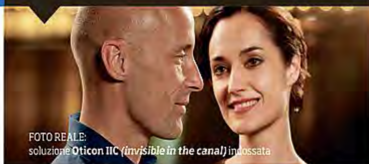
FOTO REALE: soluzione Oticon IIC ( invisible in the canal ) indossata

Non crederai alle tue orecchie. Tornerai a sentire, come mai ti aspetteresti, proteggendo la tua privacy.